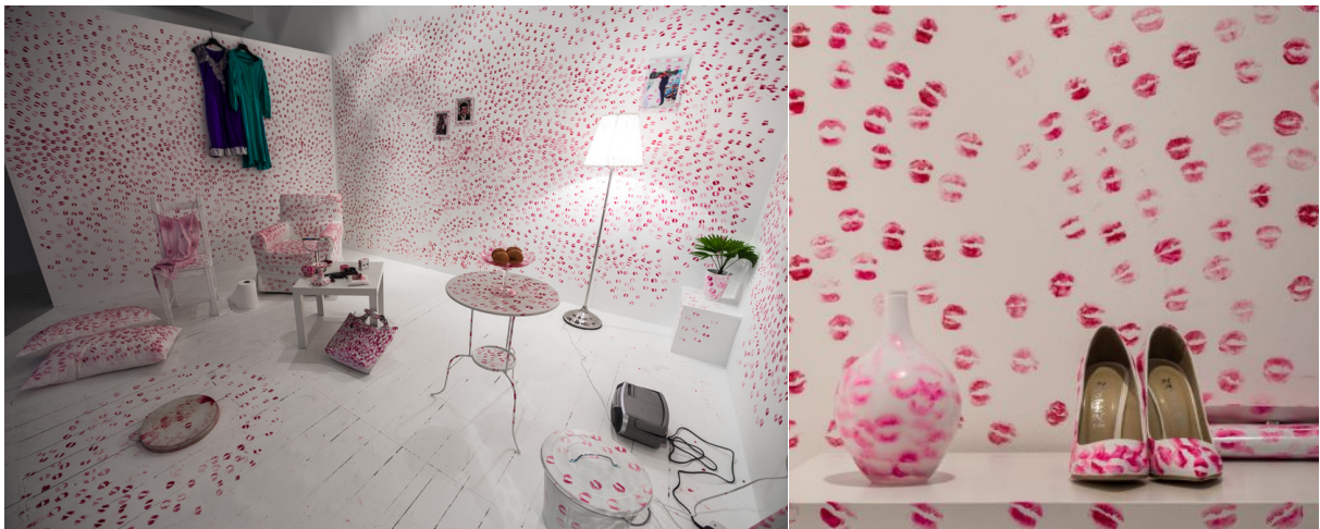
Nezaket Ekici, Emotion in Motion, Galerie Valeria Belved, Milan, 2000