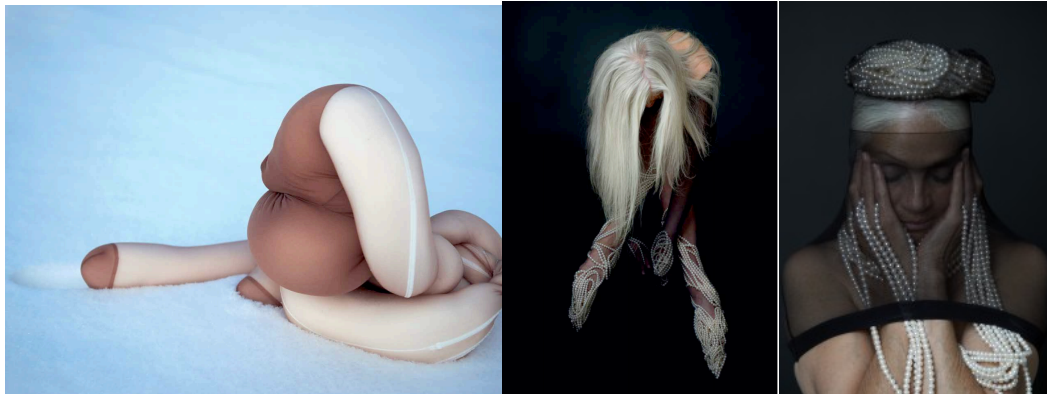
Snowbody # 3 Camel, Still Pearling # 2 och Still Pearling #1, Åsa skogberg, 2013

Smyckeskonstnären Åsa Skogberg har berört dessa frågeställningar i projektet, O Wearer Where Art Thou . Hon frågar sig var bäraren har tagit vägen och för vem vi bär. Med hjälp av "feminina" attribut som strumpbyxor och pärlcollier hittar hon nya platser och sätt för bärande, hon letar med projektet efter "delaktiga kroppar".