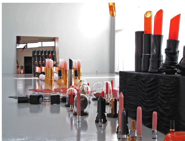
Åsa Jungnelius, In My Imagination, 2009.

Konstnären Åsa Jungnelius har jobbat med liknande frågeställningar. Hon använder ofta makeup som en stereotyp symbol och ett redskap. 17 På Vida museum skapade hon en krigsskådeplats med sminkföremål, kopplade till femininitet, och omformade dem till något som ser ut som vapen och ammunition. Jag kan se liknande referenser i mitt gestaltande men jag är inte säker på att det är ett krig jag vill starta. Jag tror mer på att skapa en skådeplats, en scenografi där en kropp har varit närvarande, kanske snarare en efterkrigsplats. Jag blir inspirerad av Åsa Jungnelius skulpturer men tycker att det kan vara begränsande att nästan uteslutande jobba i ett material, i hennes fall glas. För mig är materialvalet så viktigt, det är med materialets taktila kvalitéer, symbolik och formspråk som jag kan uttrycka mig. Jag utgår därför