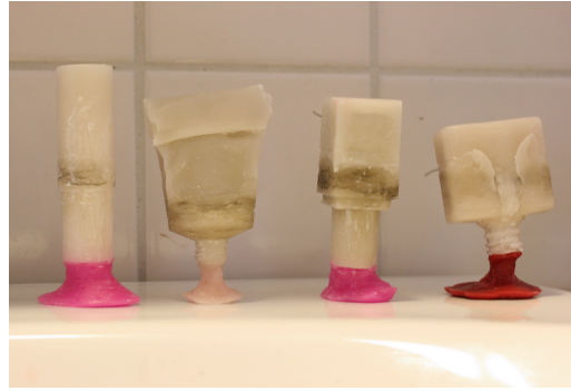
Broscher, stearin, del av det gestaltande arbetet