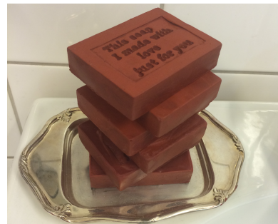
Bärbara objekt, läppstift, del av det gestaltande arbetet.