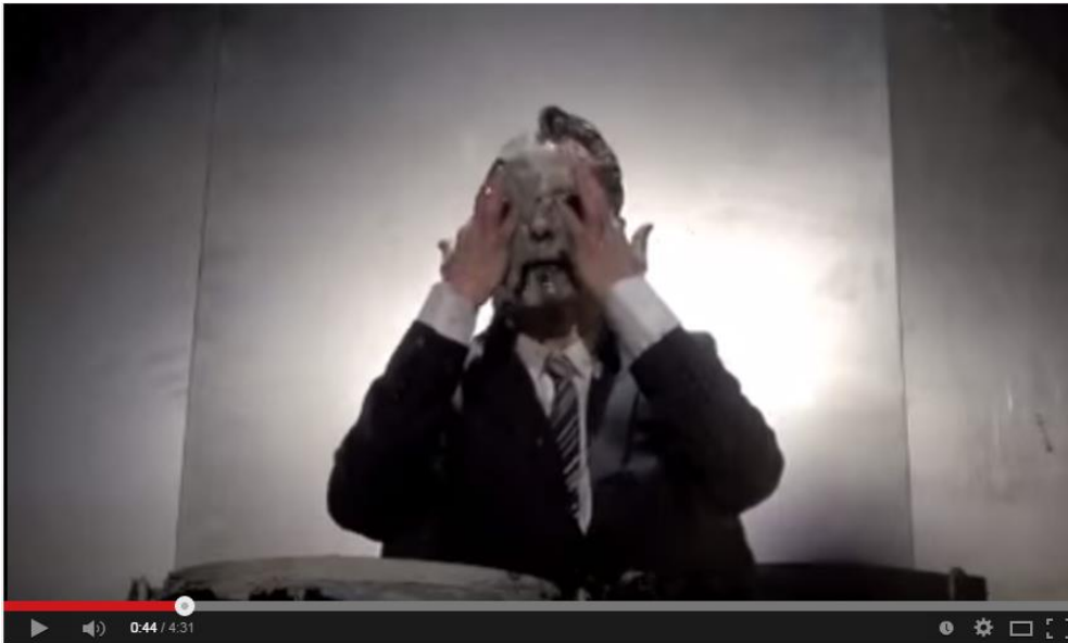
Performance Transfiguration , Olivier De Sagazan

Jag berättar inte mycket för min vän om smycket jag skapat eftersom jag vill att hon ska bilda sin egen uppfattning om det och jag säger att hon får hålla på så länge som hon känner för. Under hennes nästan 20-minuters långa improvisation har jag upplevt och sett en människas kamp med sig själv, fröjd med sig själv, talande, sjungande, kvävande, skrattande. Vid ett av tillfällena när hon står framför spegeln upptäcker hon att hon kan smörja in sig i mjölet som dammar ut från lungorna, som att bekräfta sig själv.